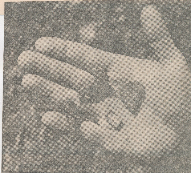
Fynden är understundom föga imponerande. Här spikdelar, bit och en skärva från husgrunden. Kanske användes huset i bostad?