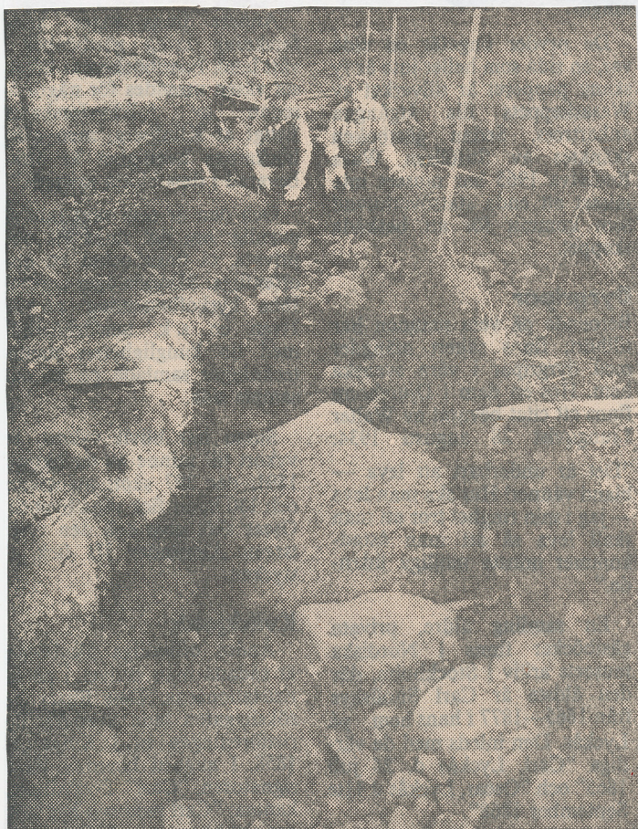
I Signhilds kulle grävs en gata upp. Inga stora fynd har gjorts ännu. Är kullen en domarehög liksom den i Gamla Uppsala?