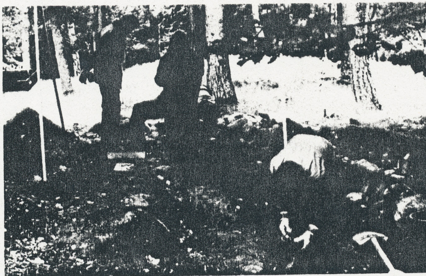
På Signhilds bur drogs ett provschakt vari framkom en del av ett golv.