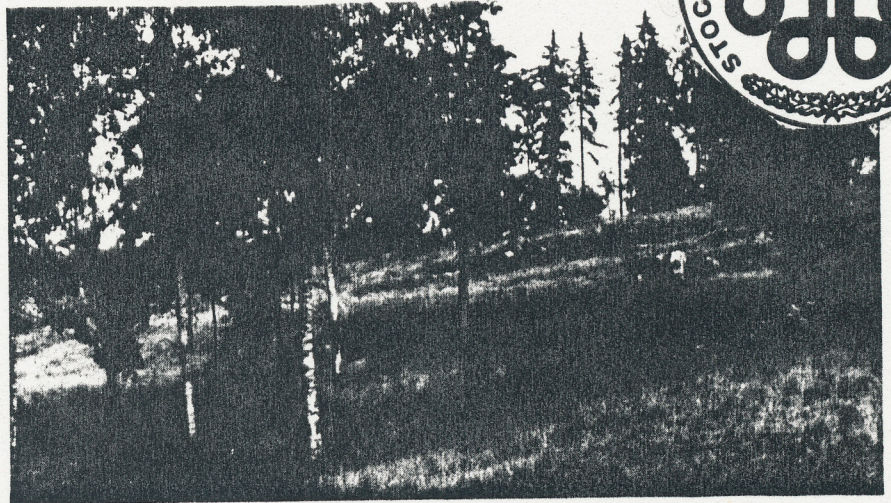
Fornlämningsområdet Fornsigtuna domineras av terrasser där man kan förvänta sig finna bebyggelserester.

gen enkelt. Först och främst en fosfatkartering för att fastställa fornminnesområdets omfattning och om möjligt bosättningsintensitet. Ett andra syfte var att få fram dateringar på bosättningen genom undersökningar i terrasserna och därvid självfallet även skapa sig en uppfattning om eventuella aktiviteter i området. Ett tredje syfte har varit att kontrollera vilken funktion kullen "Signhildsbur" haft. Har det varit en gravhög eller har det funnits ett befästningstorn på kullens topp? Anläggningen är nämligen avplanad. På de första frågorna har vi förstås ännu ej fått svar. Fosfatproverna måste analyseras och kol från husgrundsterrasserna måste C 14-dateras. Allt detta tar tid. Det bör dock påpekas, att vi vid undersökningen, som gjordes i form av några små provschakt, kunde säkra nödvändigt provmaterial. Fynd gjordes också i framför allt en av terrasserna. Här framkom keramik,